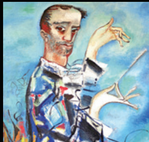
Валерий Гергиев. 1994, холст, масло