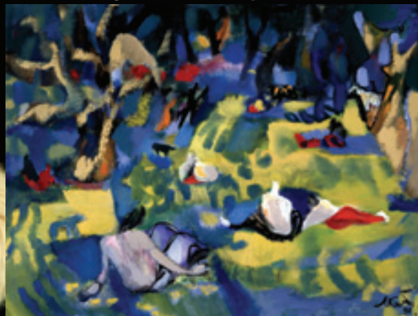
Гайд парк. 1997, холст, масло

Выставка произведений художницы Любы Костенко в Hampstead Theatre