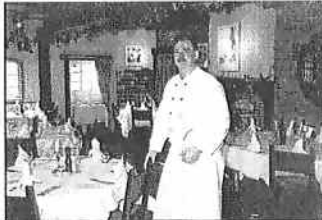
HET GC-MENU VAN DEZE MAAND SPEELT ZICH AF IN BRASSERIE DE HOOIBERG IN SCHOONHOVEN. PER BOEREFIJN IS HIER DE MAN DIE KOOKT MET PASSIE.