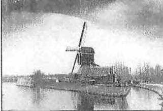
DE BONREPASSER MOLEN IN VLISST IS SINDS KORT NIET MEER IN GEBRUIK. DESONDANKS IS DE MOLEN NOG IN STAAT OM DE MODERNE GEMALEN 'BIJTE STAAN'.